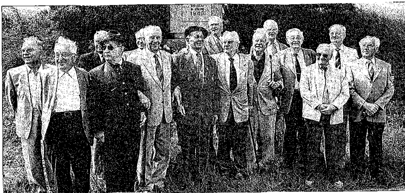
Les survivants du 99ème R.I.A., du 56ème régiment de chasseurs et du 119ème régiment de grenadiers devant la stèle du 99ème R.I.A.