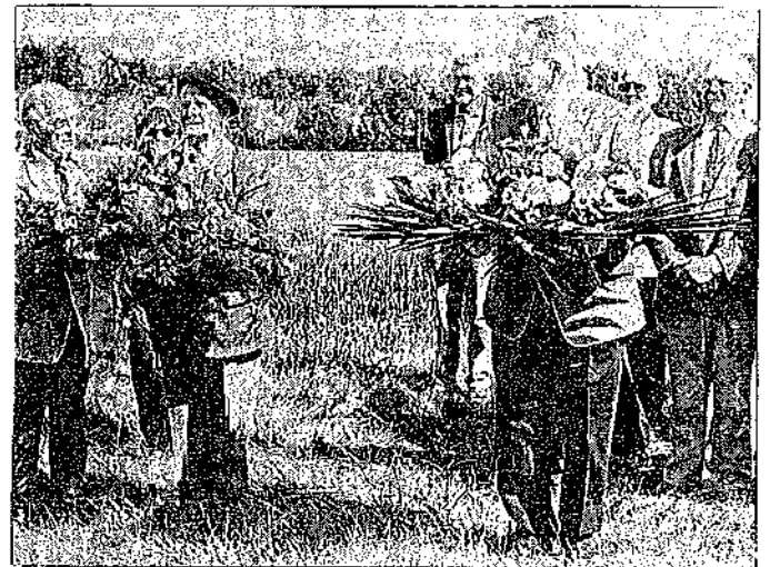
Dépôt de gerbes devant la stèle du 99ème RIA