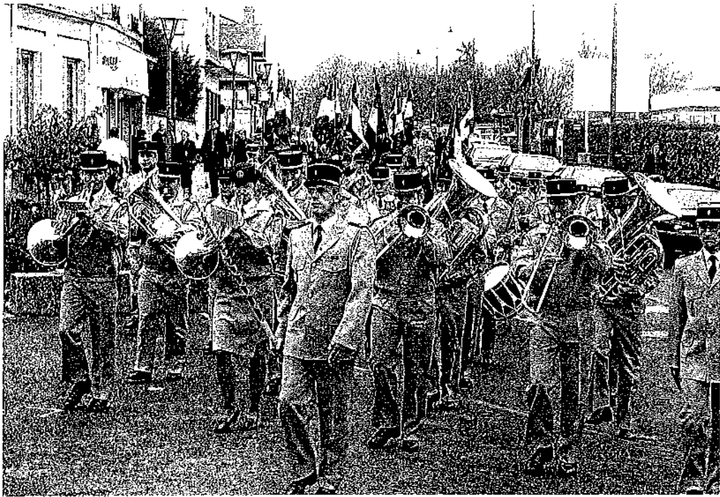
« La musique militaire régionale ».