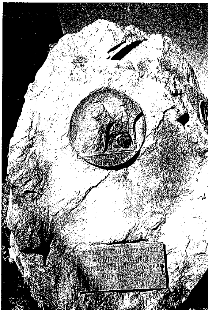
« Passant, je suis autre chose qu'un monument, peut-être plus qu'un symbole, je suis un exemple » Monument érigé à Lanslebourg en mémoire du chien Flambeau

Il est temps de faire demi-tour et de prendre la direction du Planay où doit se dérouler la cérémonie. A Bramans, nous quittons la N 6 pour la D 100, petite route de montagne qui nous propulse à 1 670 mètres d'altitude. Peu avant l'arrivée, nous faisons un petit crochet pour découvrir la merveilleuse chapelle de Saint-Pierre d'Extravache. Perchée sur un promontoire au pied du col du Petit-Mont-Cenis, elle constitue l'un des rares témoignages de l'époque romane en Savoie.