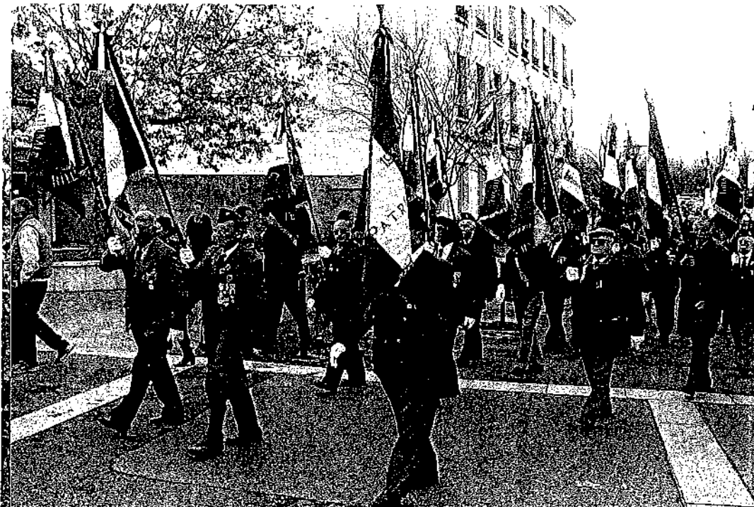
« Le défilé ».