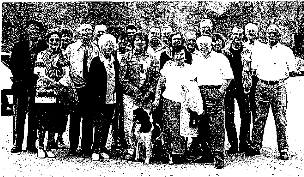
« Les participants devant le Rocher des Amoureux »

Il est temps de faire demi-tour et de prendre la direction du Planay où doit se dérouler la cérémonie. A Bramans, nous quittons la N 6 pour la D 100, petite route de montagne qui nous propulse à 1 670 mètres d'altitude. Peu avant l'arrivée, nous faisons un petit crochet pour découvrir la merveilleuse chapelle de Saint-Pierre d'Extravache. Perchée sur un promontoire au pied du col du Petit-Mont-Cenis, elle constitue l'un des rares témoignages de l'époque romane en Savoie.