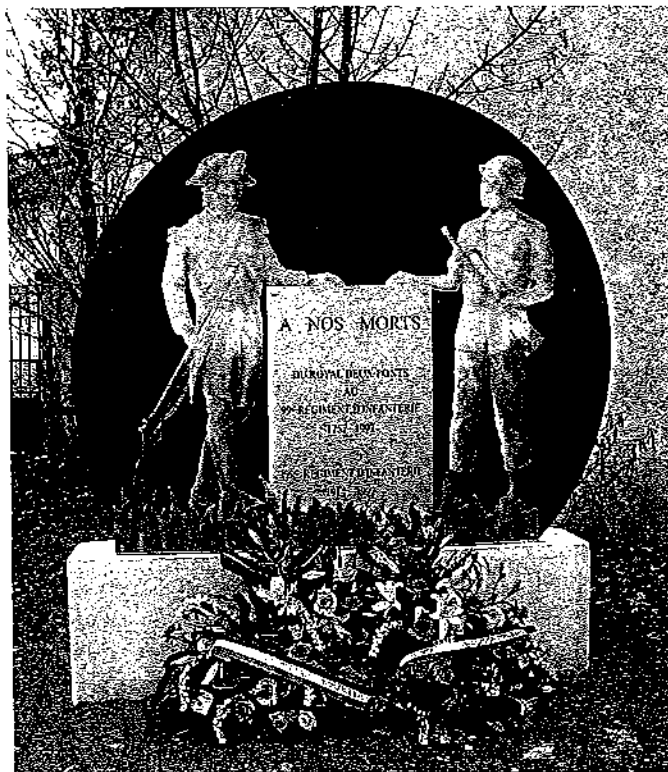
« Le nouveau monument aux morts des 99 e et 299 e RI »